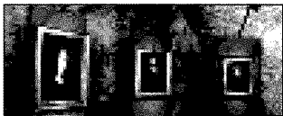
A destra la Madonna della Gatta e i resti della Torre medicea